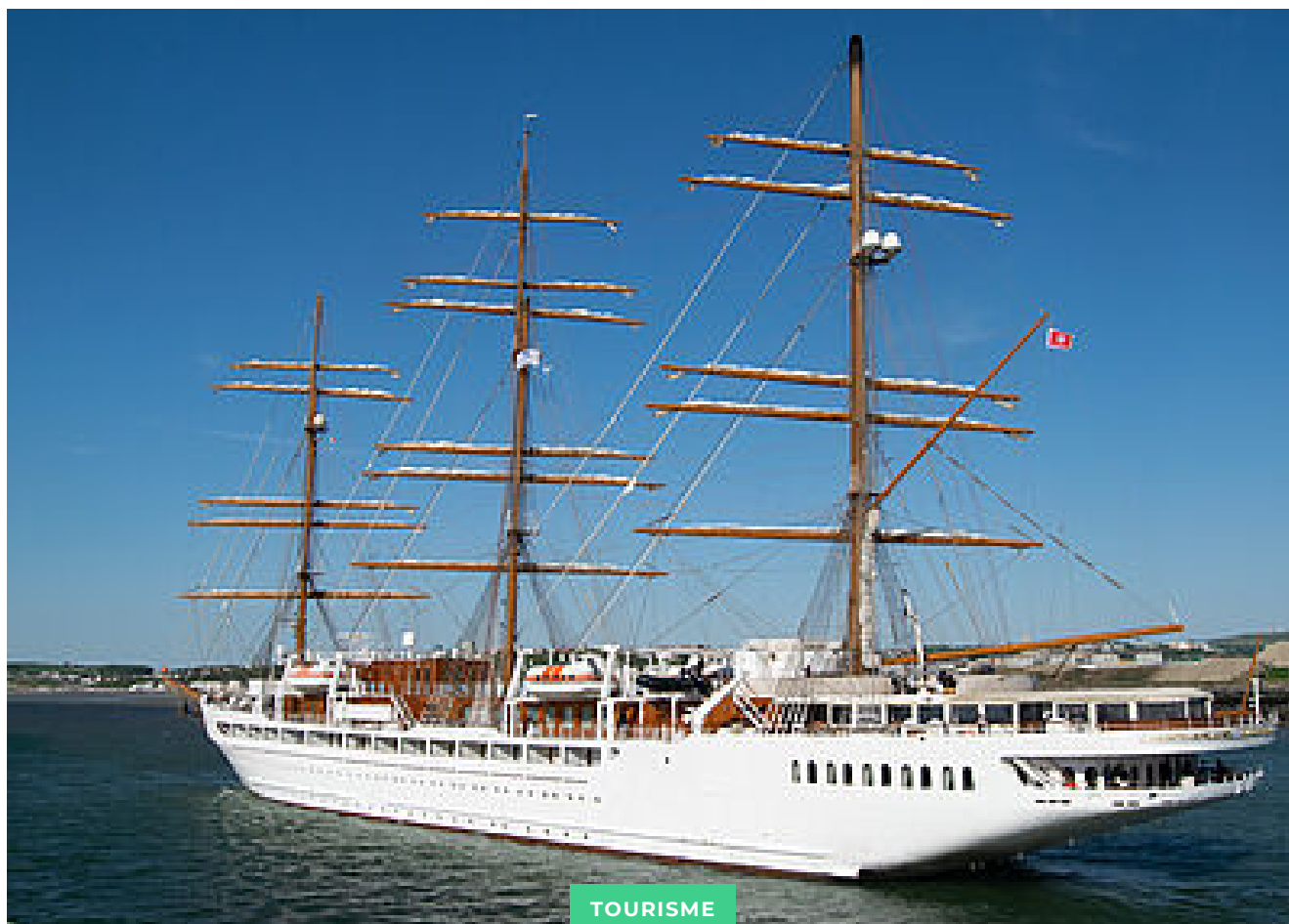
Escale du Sea Cloud Spirit au Port de Boulogne-sur-Mer