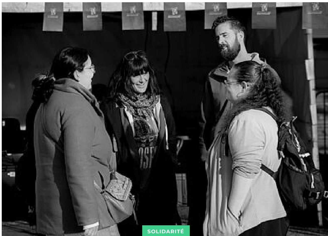
Festival Santé vous Bien