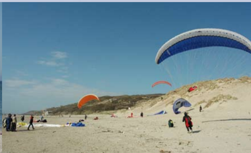
Plus sauvage, la plage d'Equihen-Plage est le rendez-vous des parapentes