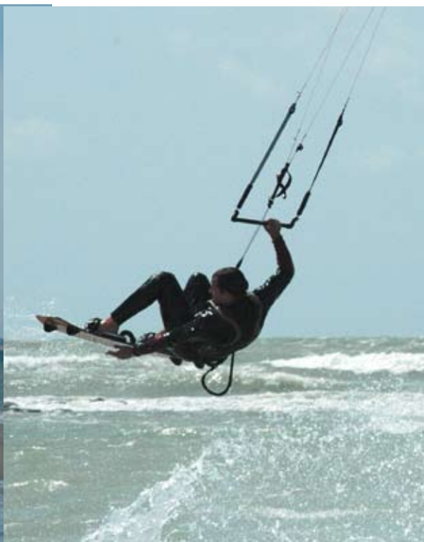
Cette discipline permet des figures très spectaculaires