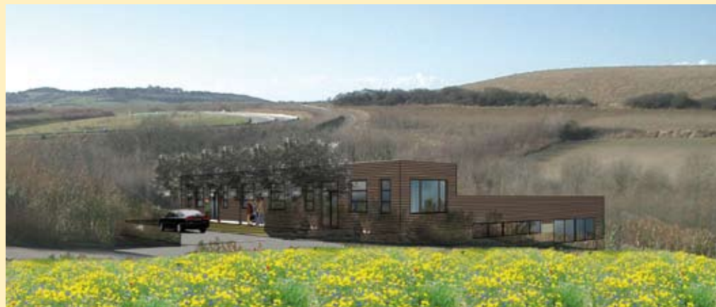
Future implantation de l'atelier-relais à Landacres (Arietur et V2R)