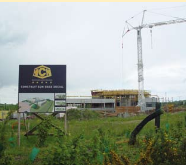
Construction des nouveaux locaux de NCN

Sur les 160 hectares du parc paysager de Landacres créé en 1997, environ 80 sont déjà occupés. ■