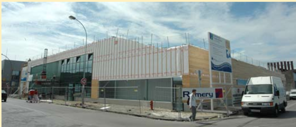
Haliocap bientôt prêt pour accueillir ses premières entreprises (Somecob)