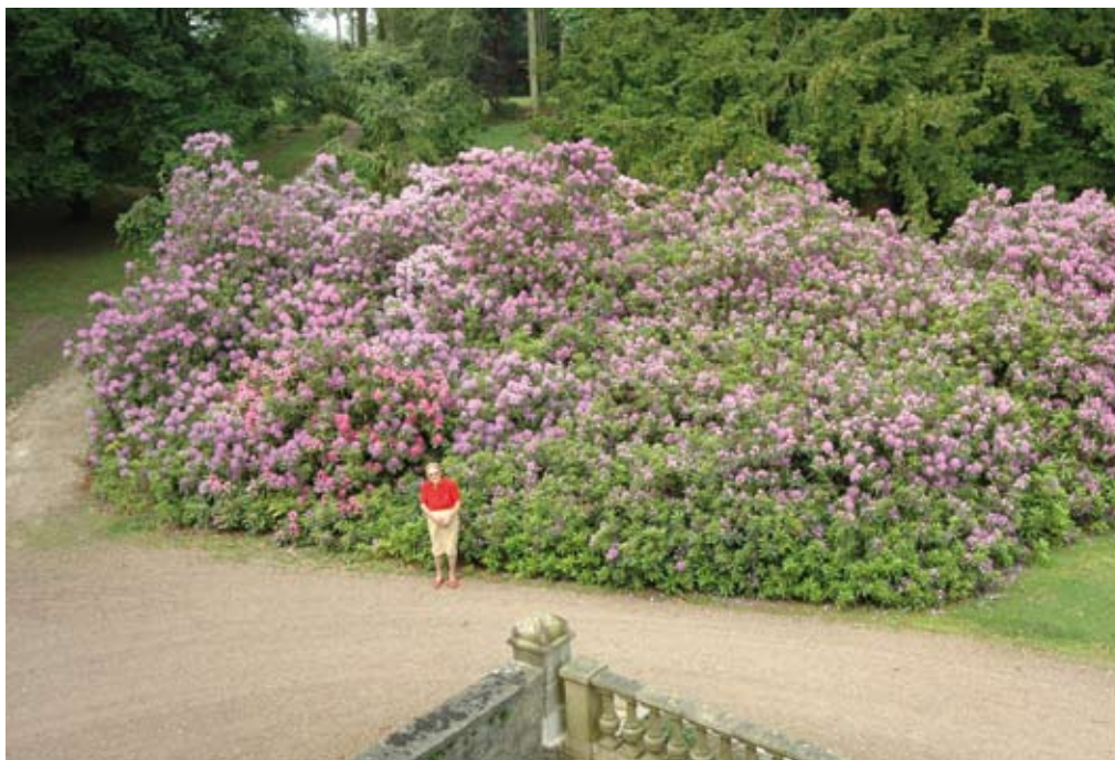
Ce rhododendron de taille exceptionnelle, est l'une des nombreuses curiosités du domaine