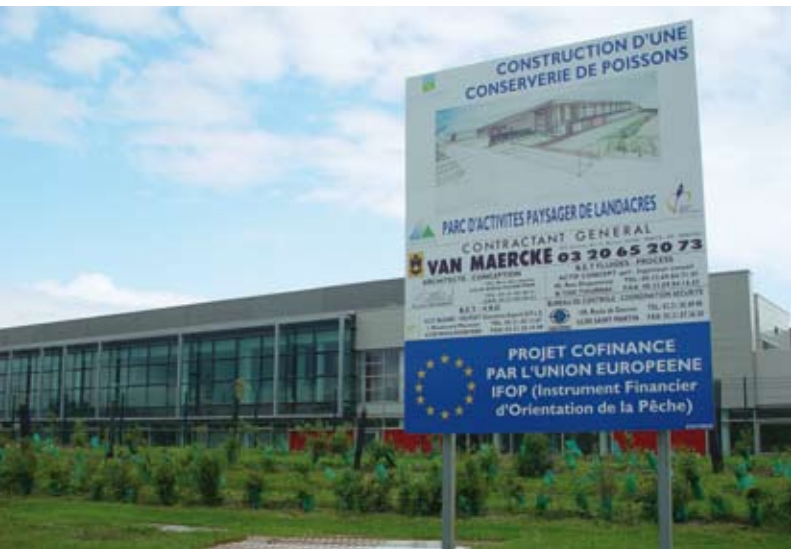
La zone de Landacres connaît un essor très important