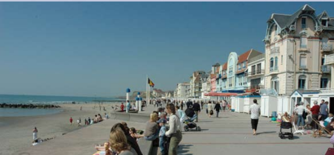
Belles façades et terrasses de café sur la digue de Wimereux