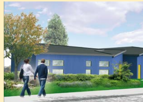
Le futur hôtel d'entreprises à Créamanche (Somecob et V2R)