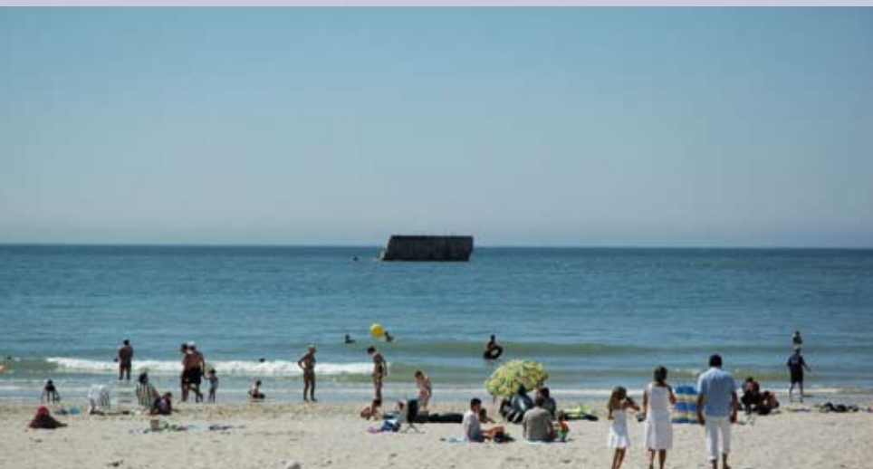
Ambiance familiale à Le Portel