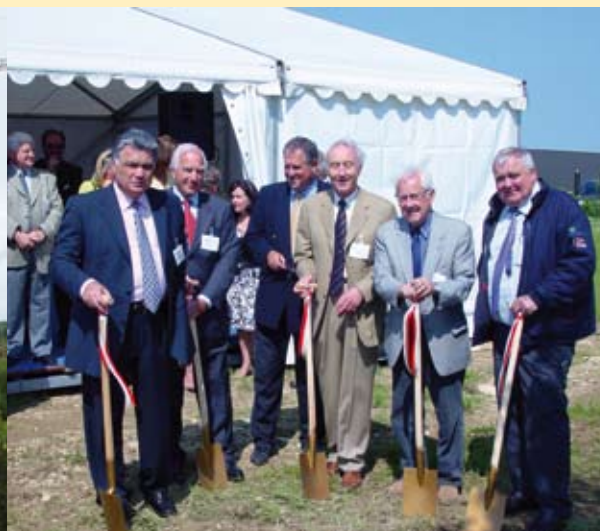
Les premiers coups de pelles pour les bâtiments d'Ecover