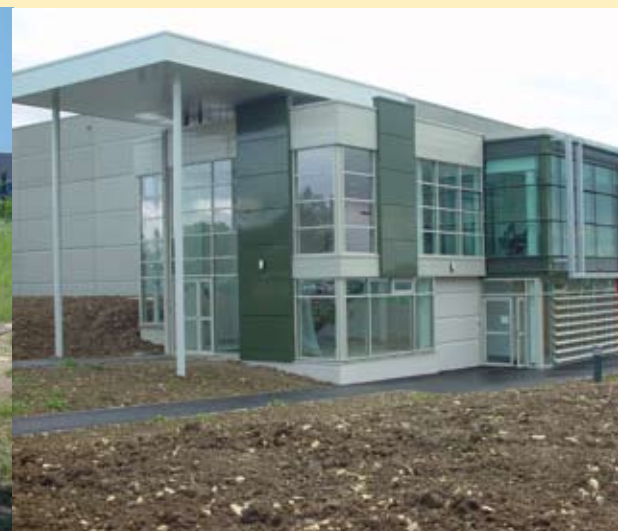
Nouveaux locaux pour Delpierre Mer et Traditions