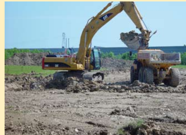
Terrassement pour les futurs locaux d'Ecover