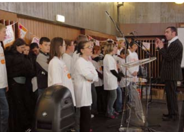
Les élèves interprètent "les dix commandements du citoyen mobile"

D epuis l'année 2000, la Communauté d'agglomération du Boulonnais coordonne localement le déroulement de "Cité Mobile". Le 2 mai dernier, l'inauguration régionale se déroulait à Boulogne-sur-Mer. Rappelons que cette opération initiée par la SNCF Nord-Pas de Calais, avec de nombreux partenaires, sensibilise les élèves au respect des transports en commun.