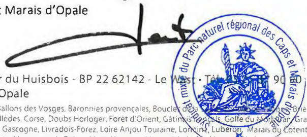
Sophie WAROT-LEMAIRE Conseillère Départementale Présidente du Parc naturel régional des Caps et Marais d'Opale

Parc naturel régional des Caps et Marais d'Opale • Manoir du Huisbois - BP 22 62142 - Le Wast - Tél : 03 20 81 90 00 info@parc-opale.fr • www.parc-opale.fr • facebook : Parc Opale