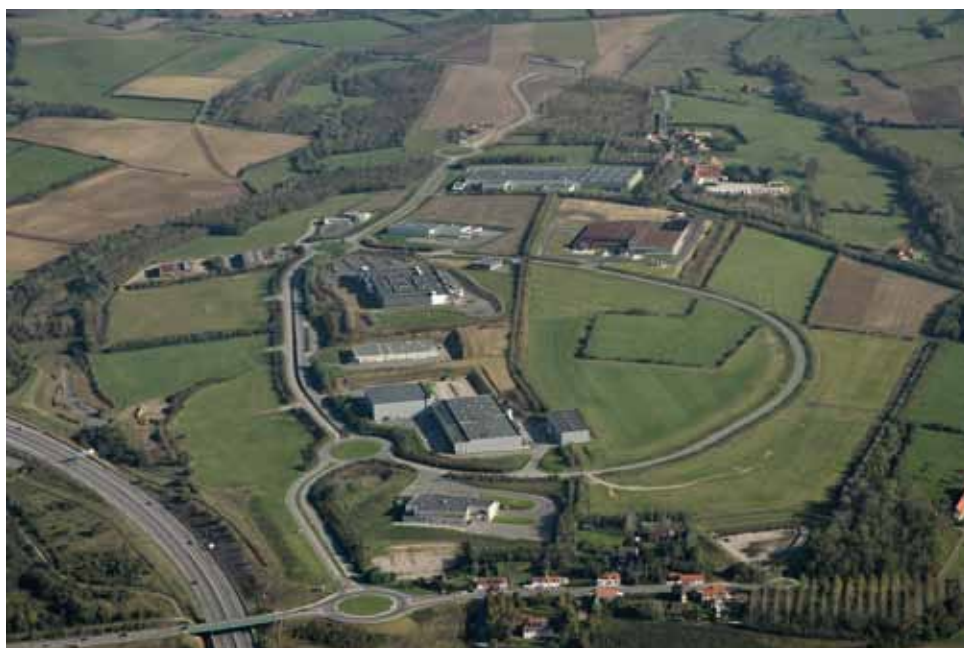
(2009) Photo aérienne NAI - Droits réservés CAB - Reproduction interdite

Tarifs au 1 er mai 2011 (délibération communautaire du 14 avril 2011)