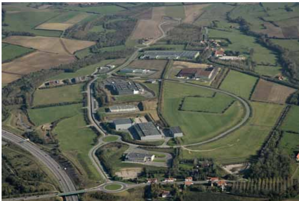
(2009) Photo aérienne NAI - Droits réservés CAB - Reproduction interdite

Tarifs au 1 er mai 2011 (délibération communautaire du 14 avril 2011)