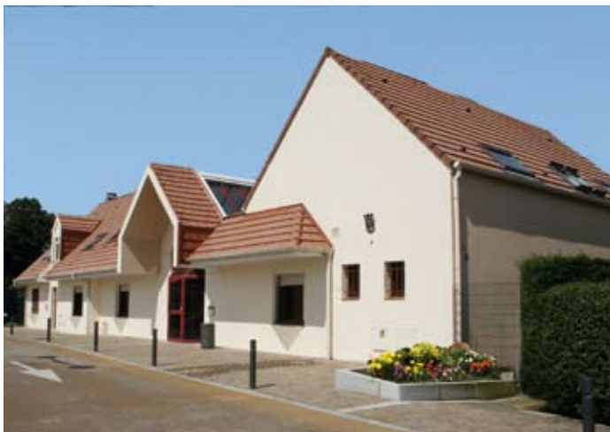
Site Camille Hautecoeur de Saint-Martin-Boulogne