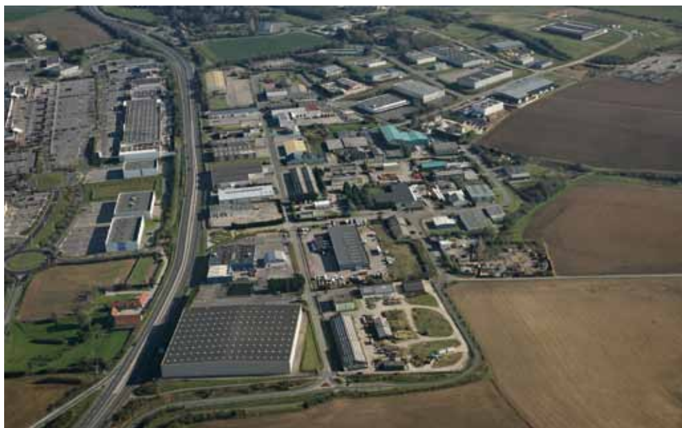
(2009) Photo aérienne NAI - Droits réservés CAB - Reproduction interdite

* Tarifs au 1 er mai 2011 (délibération communautaire du 14 avril 2011)