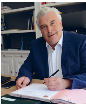
Frédéric CUVILLIER Président de la Communauté d'Agglomération du Boulonnais Maire de Boulogne-sur-Mer Ancien Ministre