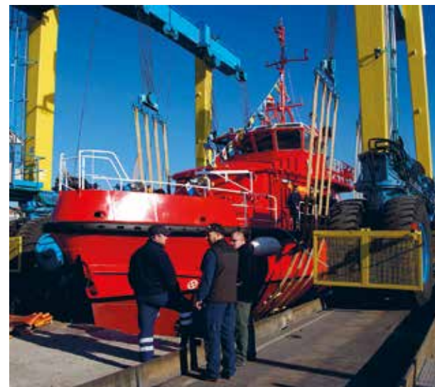
Direction Marseille pour Le " Capitaine de corvette Paul Brutus " lancé en ce mois de février