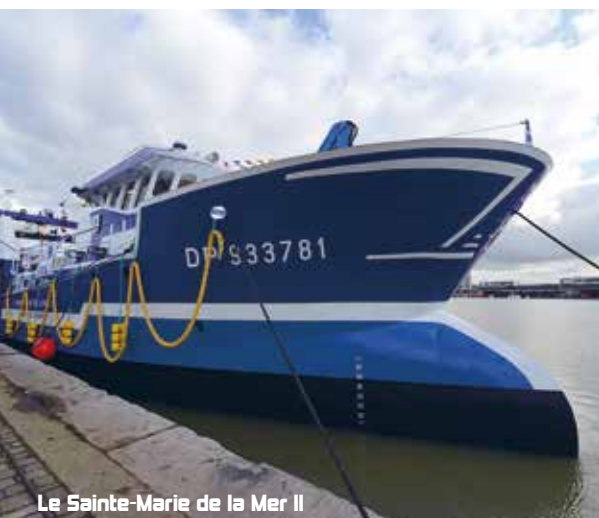
Le Sainte-Marie de la Mer II