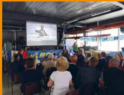
Le champion pouvait compter sur ses supporters boulonnais réunis au local du BCK