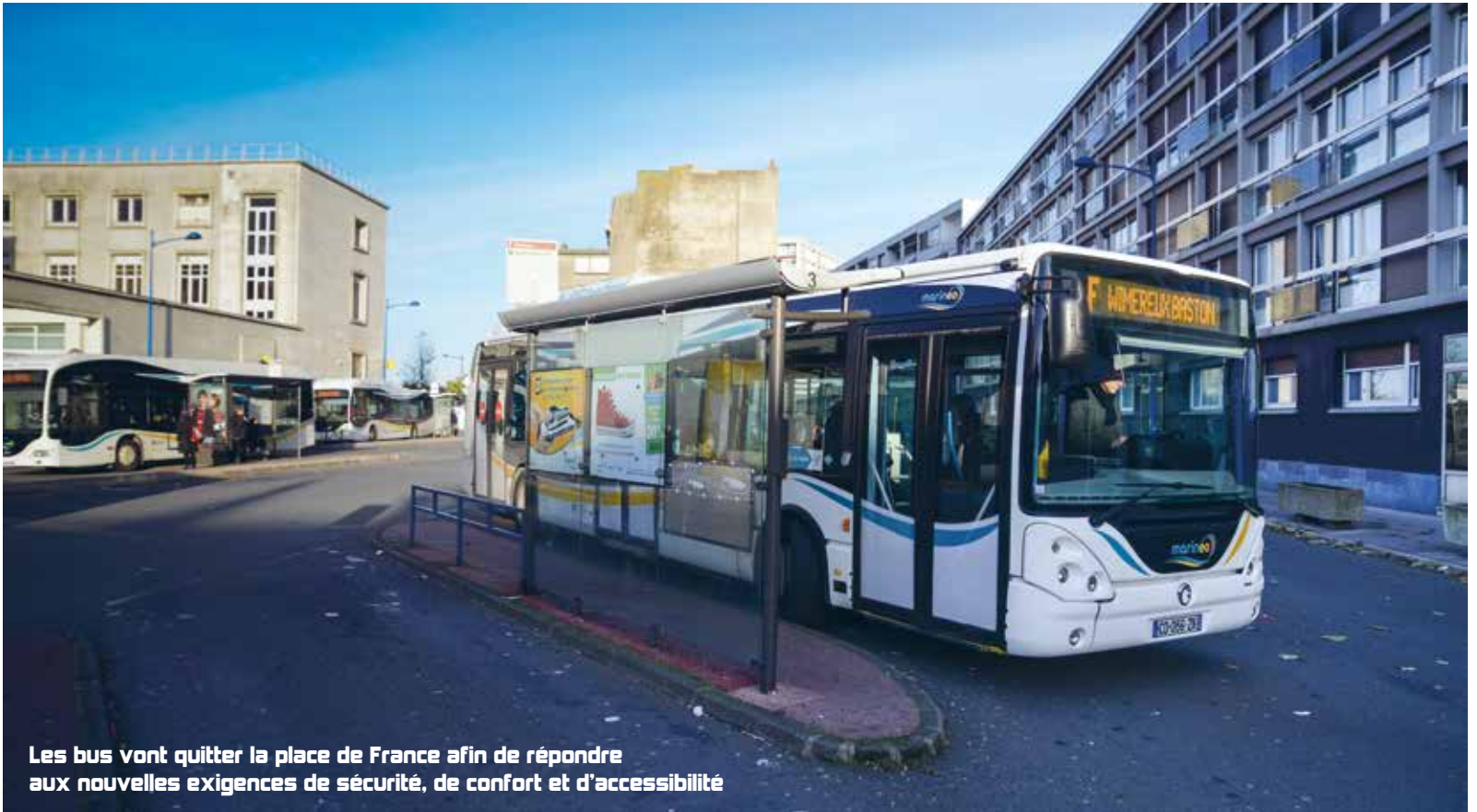
Les bus vont quitter la place de France afin de répondre aux nouvelles exigences de sécurité, de confort et d'accessibilité

Les bus de la place de France vont prochainement déménager boulevard Daunou dans une nouvelle gare routière répondant à de nouveaux critères de sécurité, de confort et d'accessibilité.