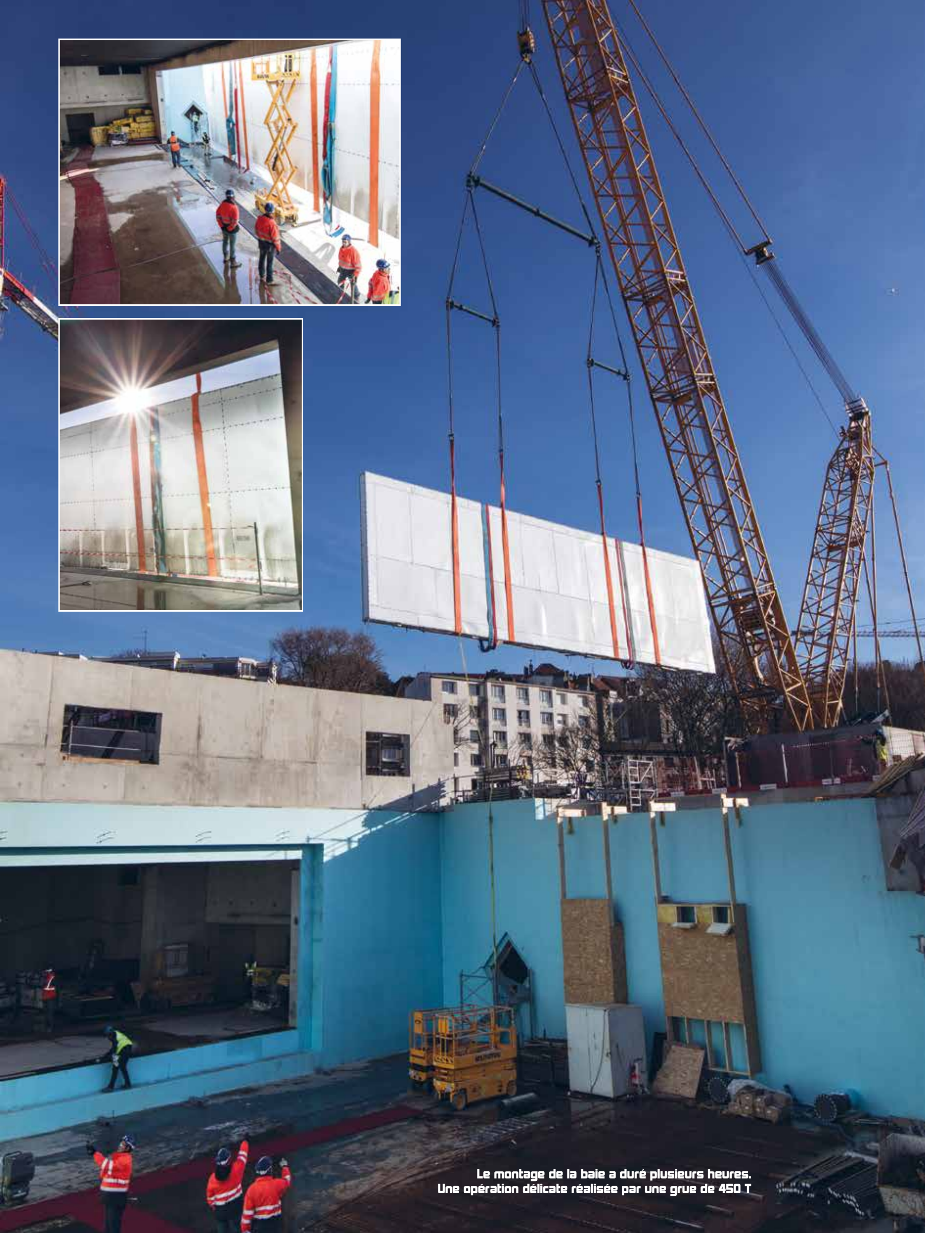
Le montage de la baie a duré plusieurs heures. Une opération délicate réalisée par une grue de 450 T