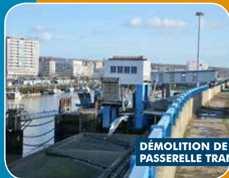
DÉMOLITION DE L'ANCIENNE PASSERELLE TRANSMANCHE