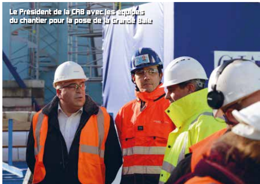
Le Président de la CAB avec les équipes du chantier pour la pose de la Grande Baie