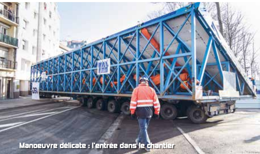
Manoeuvre délicate : l'entrée dans le chantier