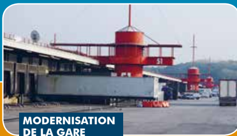
MODERNISATION DE LA GARE DE MARÉE