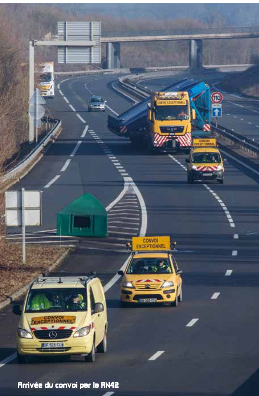
Arrivée du convoi par la RN42

C'est peu dire qu'elle était attendue par tous. La grande baie du Grand Nausicaà, celle qui offrira un panorama exceptionnel sur le futur plus grand aquarium d'Europe (9.500 m 3 ), est arrivée en ce début d'année sur le chantier boulonnais.