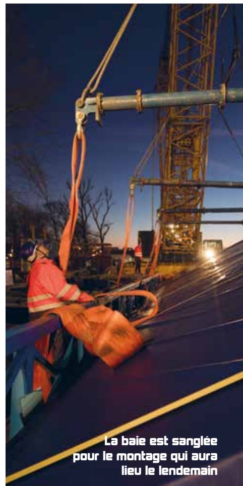
La baie est sanglée pour le montage qui aura lieu le lendemain

Dès le lendemain, la société qui a réalisé cette baie de méthacrylate procédait à son installation. Une opération extrêmement délicate car il s'agit de manoeuvrer un objet de 54 tonnes au millimètre près ! Cette opération se fait grâce à une grue de 450 tonnes arrivée sur place il y a quelques semaines. Au bout de quelques heures, la baie est posée. L'opération s'est parfaitement déroulée au grand soulagement de tous les acteurs du chantier. L'évènement retransmis sur le web a passionné de très nombreux internautes.