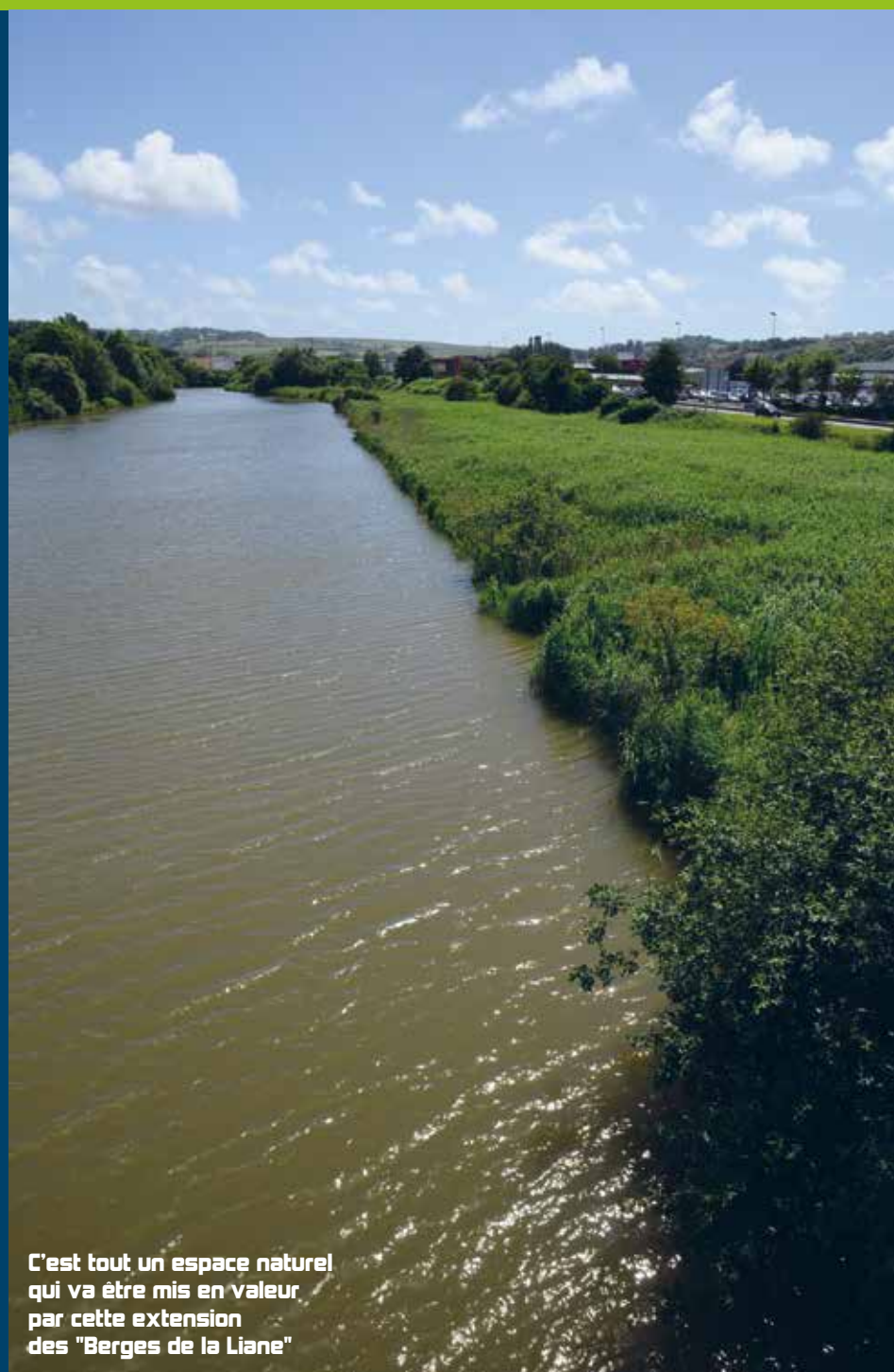
C'est tout un espace naturel qui va être mis en valeur par cette extension des "Berges de la Liane"