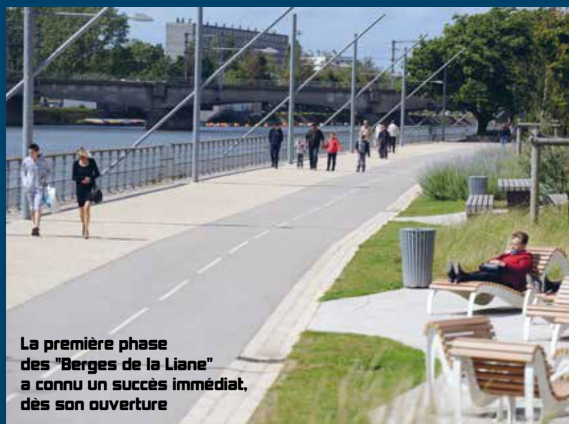
La première phase des "Berges de la Liane" a connu un succès immédiat, dès son ouverture

Une présentation du projet a été faite à l'occasion de la venue d' Estelle Grelier, Secrétaire d'Etat chargée des Collectivités Territoriales , puisque celui-ci a bénéficié du Fonds de Soutien de l'Etat à l'Investissement Local (FSIL). Près de 40 % du financement est donc pris en charge par l'Etat.