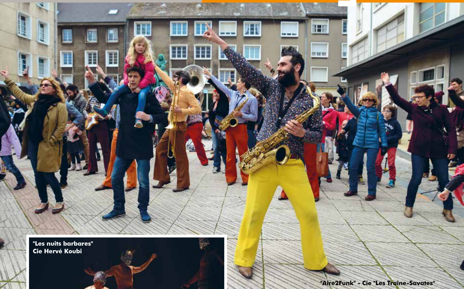
"Aire2Funk" - Cie "Les Traîne-Savates"