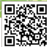
La nouvelle carte détaillant les 10 sentiers de randonnée parcourant ce site exceptionnel

Scannez ce QR-code pour visionner la carte et accéder à un descriptif des différents circuits sur votre smartphone