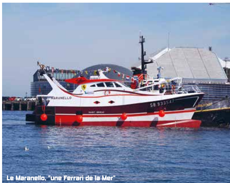
Le Maranello, "une Ferrari de la Mer"

Cette double mise à l'eau, en présence des familles des équipages,