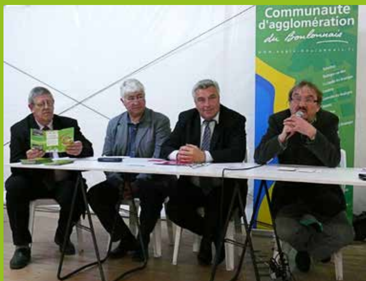
Réunion publique à Hesdigneul en 2012, en présence d'élus communautaires

Ces rendez-vous ont permis de nourrir les réflexions des urbanistes et chargés de projets afin de proposer des aménagements en adéquation avec les attentes des usagers.