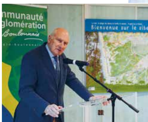
Jean-Loup Lesaffre, Président de la Communauté d'Agglomération du Boulonnais, partie prenante dans cette mise en valeur du site d'Écault.