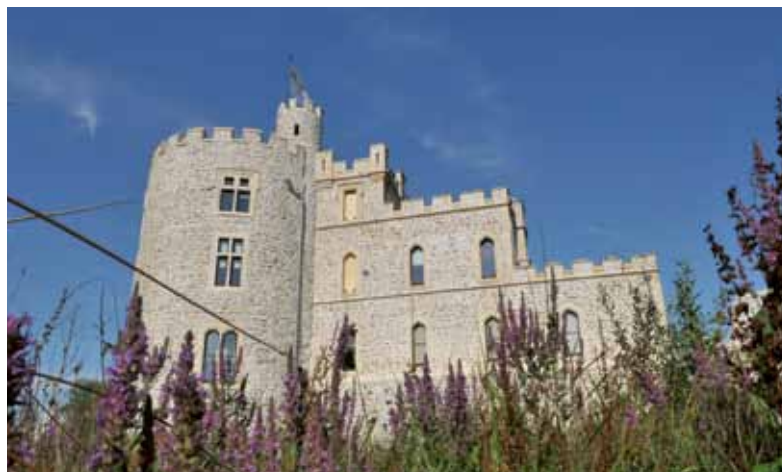
Le sentier du château, au départ de Condette : 14km de nature

Ces réalisations sont financées à hauteur de 67 500 € par la CAB. Le Pays Boulonnais, via le fonds européen d'aménagement et de développement rural finance 82 500 €, tandis que l'ONF participe à hauteur de 35 600 €.