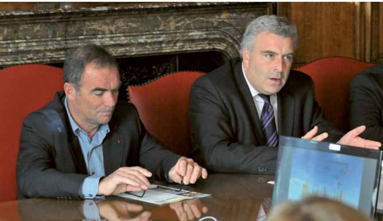
Lors de la conférence de presse en mairie de Boulogne-sur-Mer, Bernard HINAULT, le quintuple vainqueur du Tour, membre de l'organisation, et Frédéric CUVILLIER ont présenté l'étape boulonnaise à la presse

Le Boulonnais est décidément une terre de cyclisme. Après le succès des derniers championnats de France en juin dernier, le Boulonnais accueillera le Tour de France en juillet prochain.