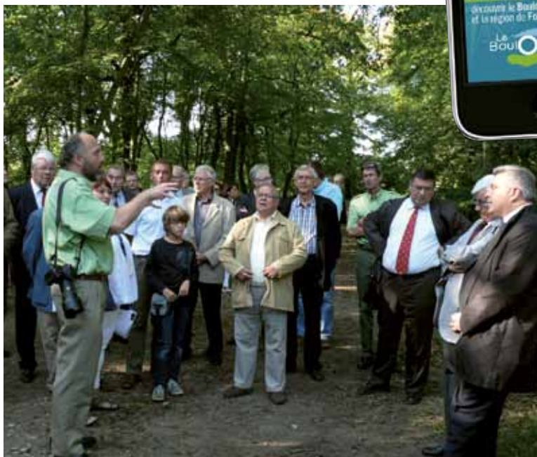
Présentation des aménagements du sentier des Aulnes