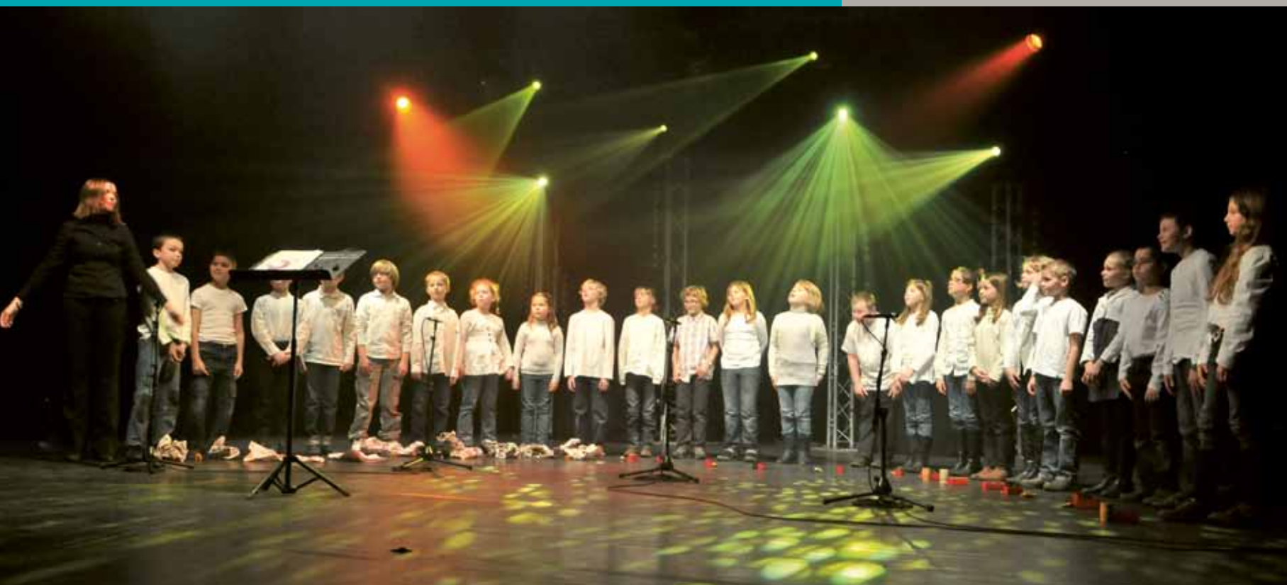
Spectacle sur scène avec un musicien intervenant de la CAB