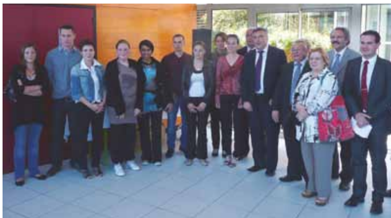
Les jeunes boursiers et les élus, lors de la remise officielle de la bourse