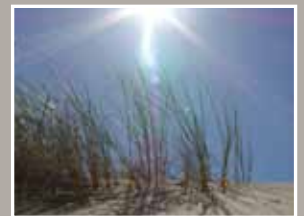
Le Boulonnais s'engage contre le réchauffement climatique