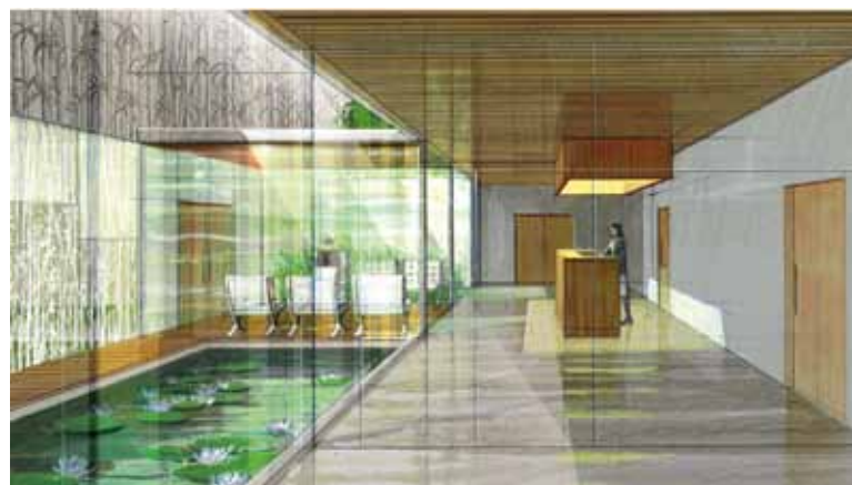
Hall du futur crématorium

fumées afin d'éliminer les rejets de polluants dans l'atmosphère. Le "Rivage" sera opérationnel en 2012. ■