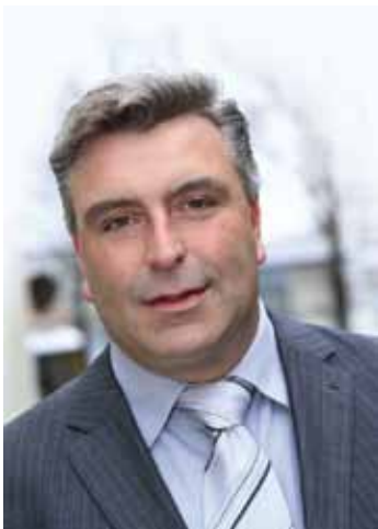
Frédéric CUVILLIER Président de la Communauté d'agglomération du Boulonnais Député-Maire de Boulogne-sur-Mer