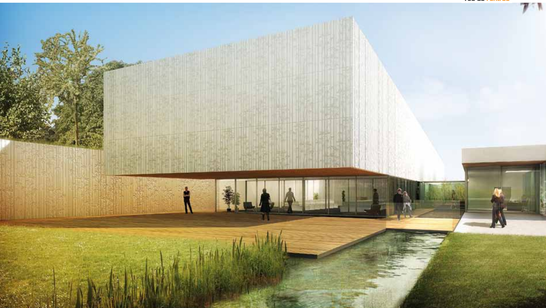
Vue de l'entrée