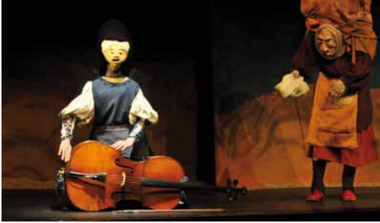
La Cie La Cuillère a présenté son spectacle aux classes participant au Cléa