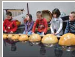
Cléa ou les belles aventures artistiques des petits boulonnais