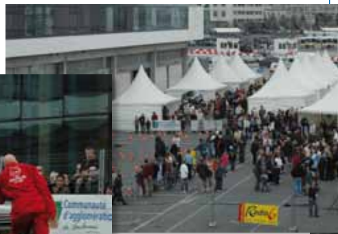
Samedi 28 octobre 2006 Boulogne-sur-Mer Village sécurité routière 2006