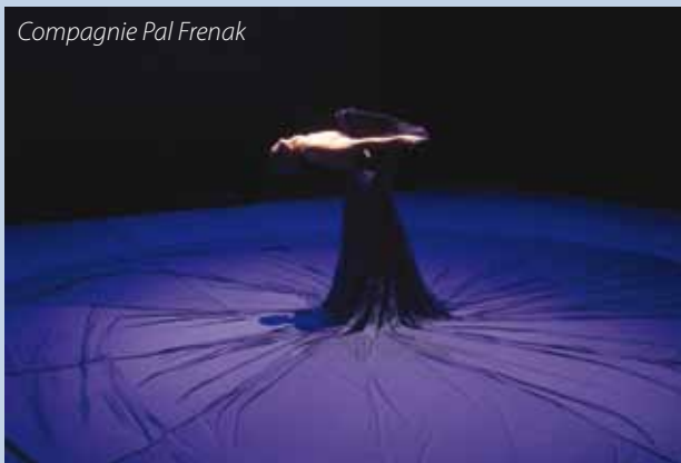
Compagnie Pal Frenak

Renseignements : ENMD 47, rue des Pipots 62200 Boulogne-sur-Mer Tél. : 03 21 99 91 20