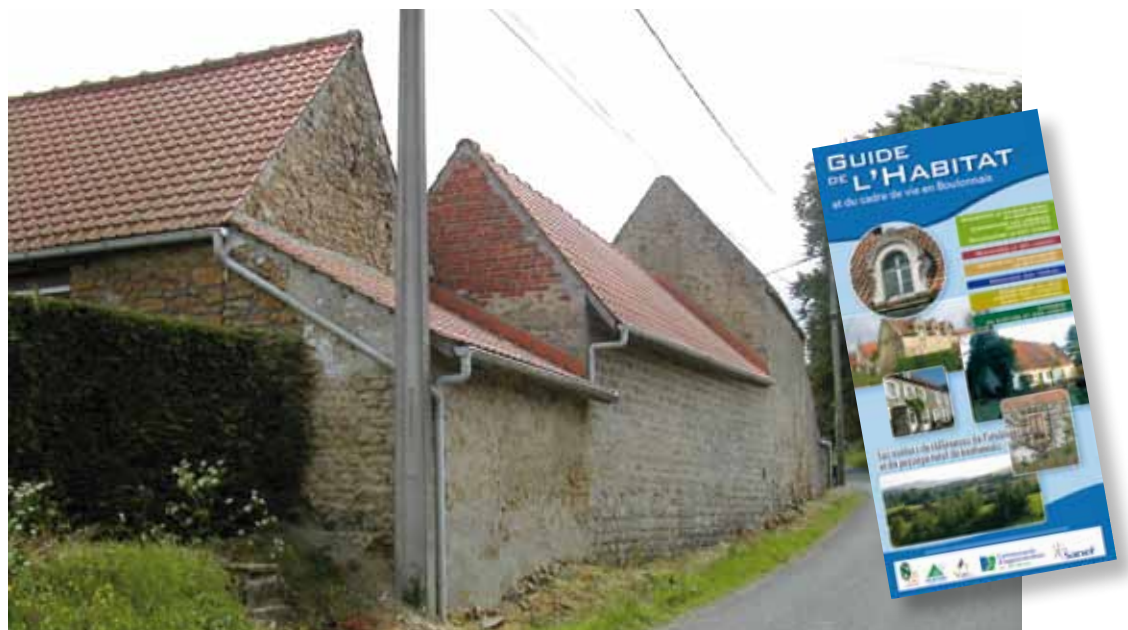
Pour préserver notre patrimoine architectural, le guide se révélera un outil précieux