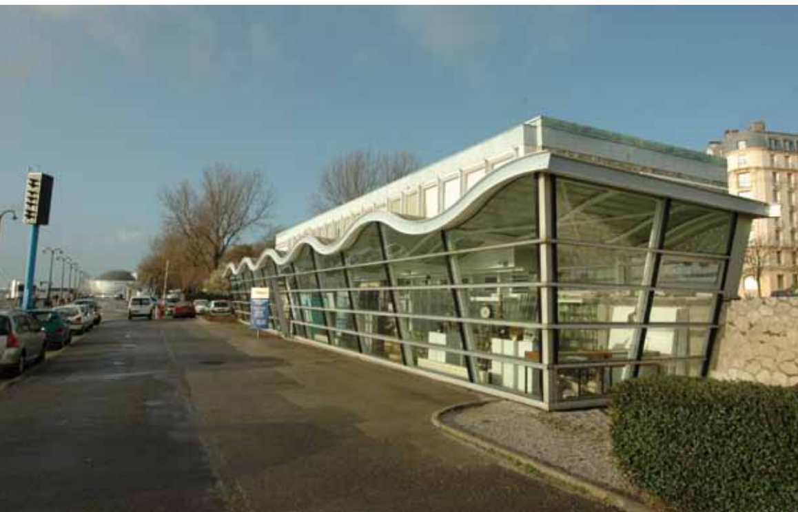
Les locaux d'Ifremer sont situés à quelques mètres seulement de Nausicaà

L' Ifremer dispose de cinq centres principaux et de 26 implantations sur le littoral, y compris les DOM TOM, de sept navires, d'un submersible et d'un autre téléguidé pour les grandes profondeurs. Nausicaà abrite le bassin d'essais hydrodynamique de l'Ifremer, un équipement à rayonnement international.