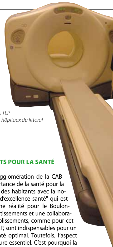
Outil de pointe, le TEP est au service des hôpitaux du littoral

Le TEP permet d'obtenir une image entière du corps. Pour cela, un produit spécifique est injecté au patient. Cette substance possède la particularité de se fixer au niveau des éventuelles cellules tumorales. Très faiblement radioactif (comme pour une "radio" classique), le TEP détecte donc la zone concernée et permet d'analyser la tumeur. Rapide et efficace, le TEP offre la possibilité de mettre en œuvre ensuite le traitement adapté.