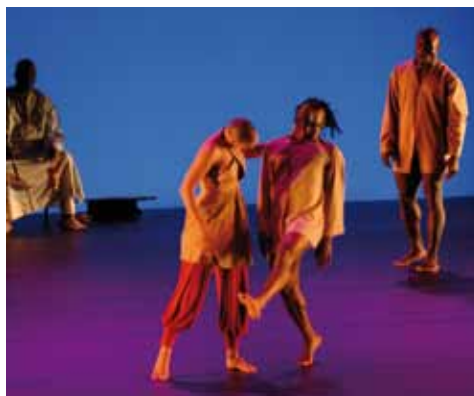
"Poulpaphone", "Semaines de la danse", ou encore le concours Menuhin, la CAB a acquis une belle expérience dans l'organisation d'événements culturels.

"Poulpaphone" à Outreau en octobre dernier. Avec une salle spécialement conçue pour accueillir des spectacles, des concerts dans les meilleures conditions, "L'Escale" et son matériel, la CAB propose des moyens, fixes et mobiles, pour la vie culturelle de notre agglomération. ■