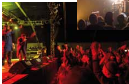
20, 21 et 22 octobre 2006 Outreau Poulpaphone 2006