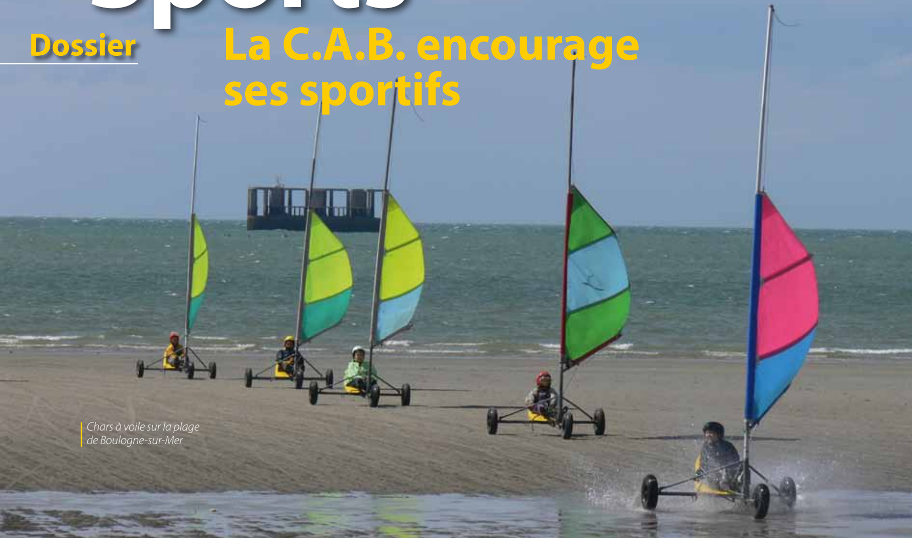
Chairs à voile sur la plage de Boulogne-sur-Mer