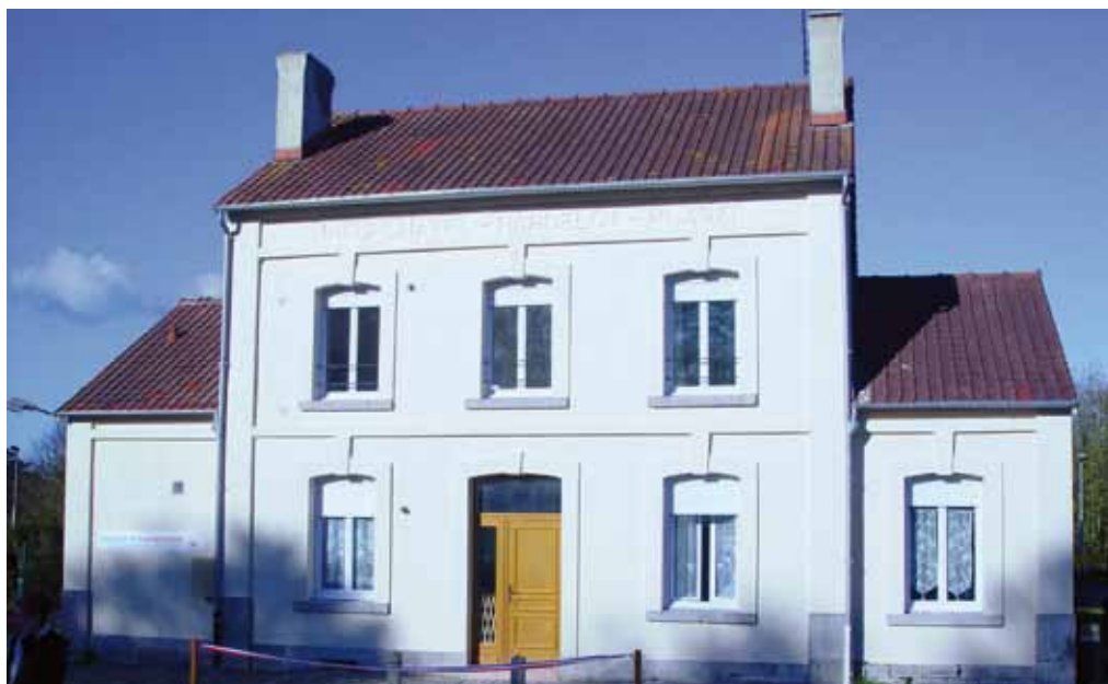
L'ancienne gare rénovée a fière allure. Un chantier exemplaire qui demande à faire école.

Antenne Littoral : 8, place de la Résistance 62200 Boulogne-sur-Mer Tél. : 03 21 92 72 09