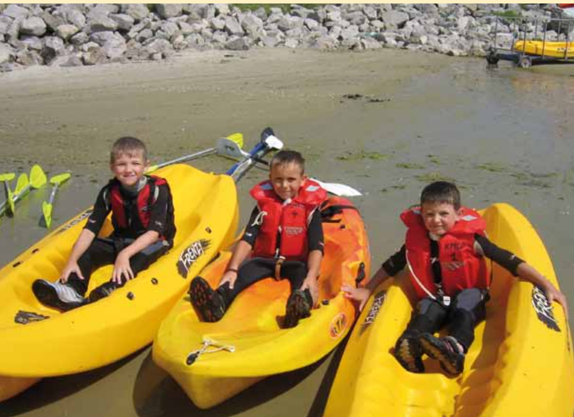
Concentration avant l'effort pour ces jeunes sportifs nautiques

L' activité sportive demeure une façon de se construire, d'entretenir sa condition physique, de découvrir de nouveaux plaisirs. Le Boulonnais permet de pratiquer les sports les plus populaires, les plus répandus, mais également ceux qualifiés de nautiques,