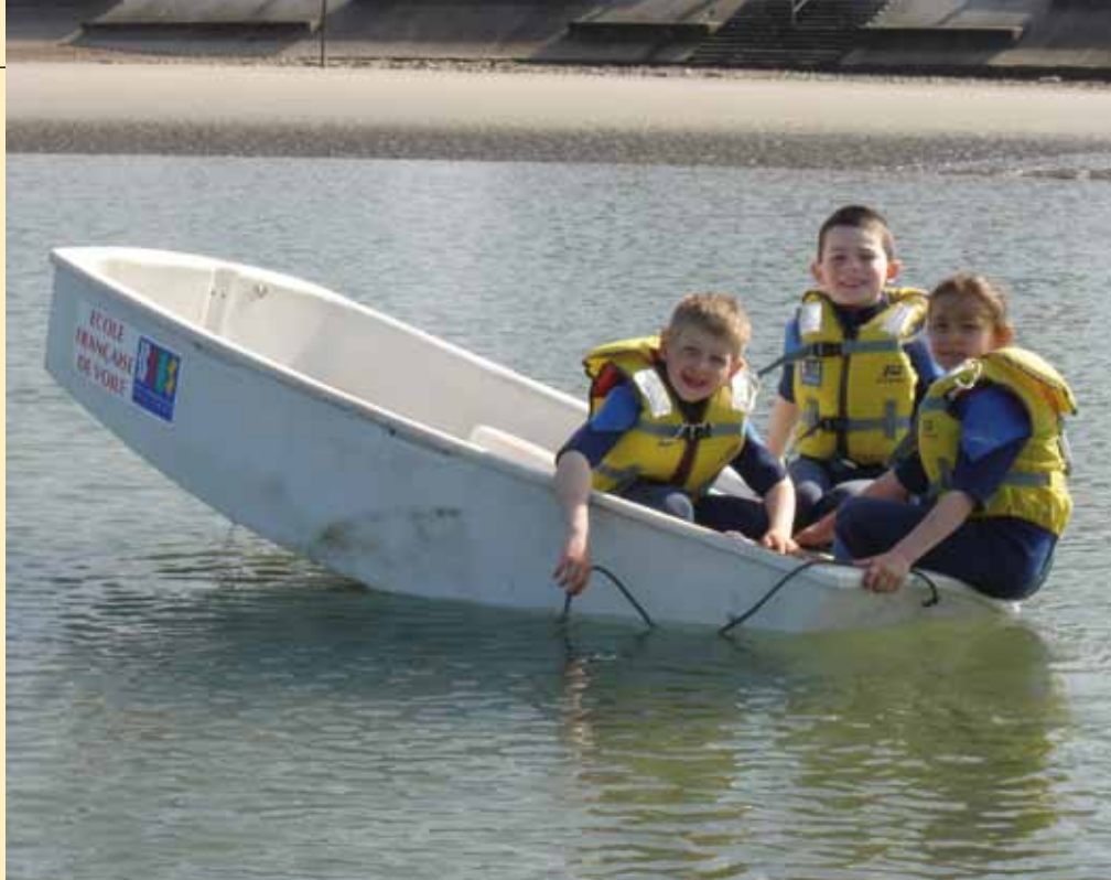
Trois moussaillons souriants malgré une posture hasardeuse !

Un travail important en direction des centres de loisirs va permettre de renforcer le dispositif. Parmi les nouveautés 2007, nous pouvons citer la mise en place de stages d'aisance aquatique en direction des jeunes des centres de loisirs (partenariat avec le SCB) et de baptêmes de plongée (partenariat avec le CSMCO).