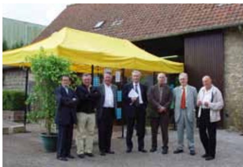
23 et 24 septembre 2006 Saint-Martin-Boulogne Journées portes ouvertes au refuge intercommunal