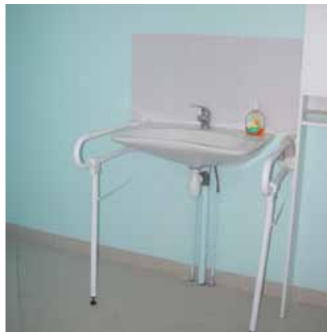
Exemple d'un équipement qui facilite grandement le quotidien de la personne handicapée

peut désormais aller et venir dans l'intégralité de l'espace de sa maison, être autonome dans la salle de bain, les portes devenues coulissantes ne sont plus gênantes... L'objectif est atteint : conditions de vie améliorées en restant dans le même logement. ■